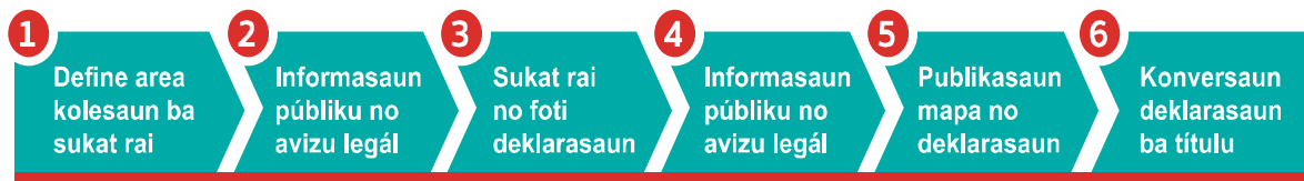
Figura 1: Prosesu Rejistrasaun Rai tuir lei Timor-Leste