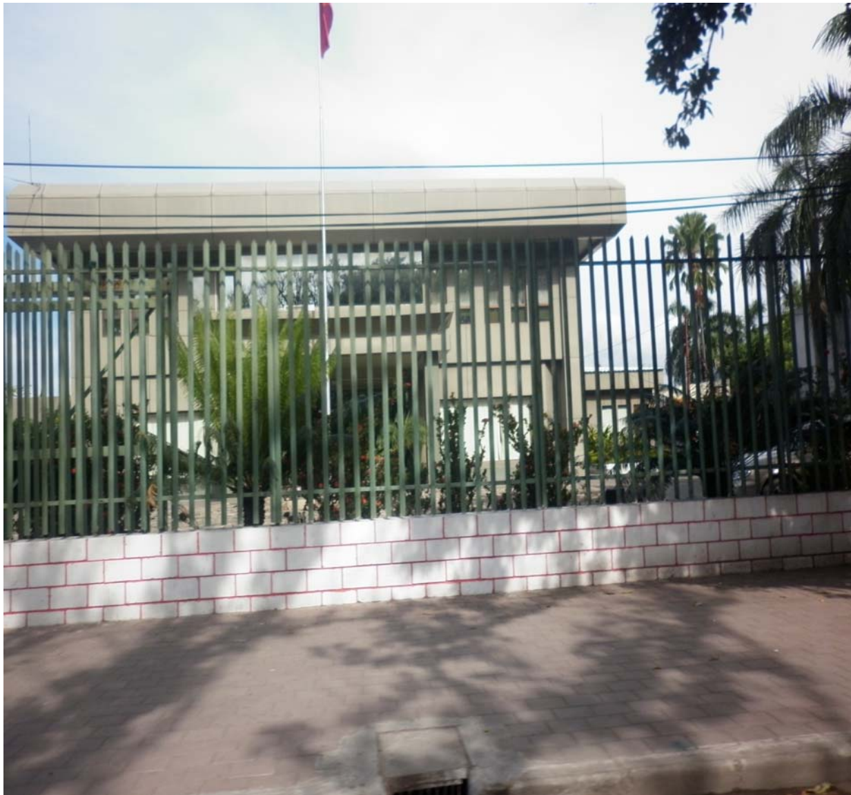
BANCO CENTRAL DE TIMOR-LESTE

Iha tinan 2010, kompras assets/ativus kapital nian ho valor $54m. Indústria 'Manufatura nian' investe tan fali ho proporsaun ne'ebé boot liuhotu husi nia lukrus ba iha despezas kapital nian, ho 45 pursentu husi lukrus utiliza osan ho valor $9m husi kompras kapital nian.