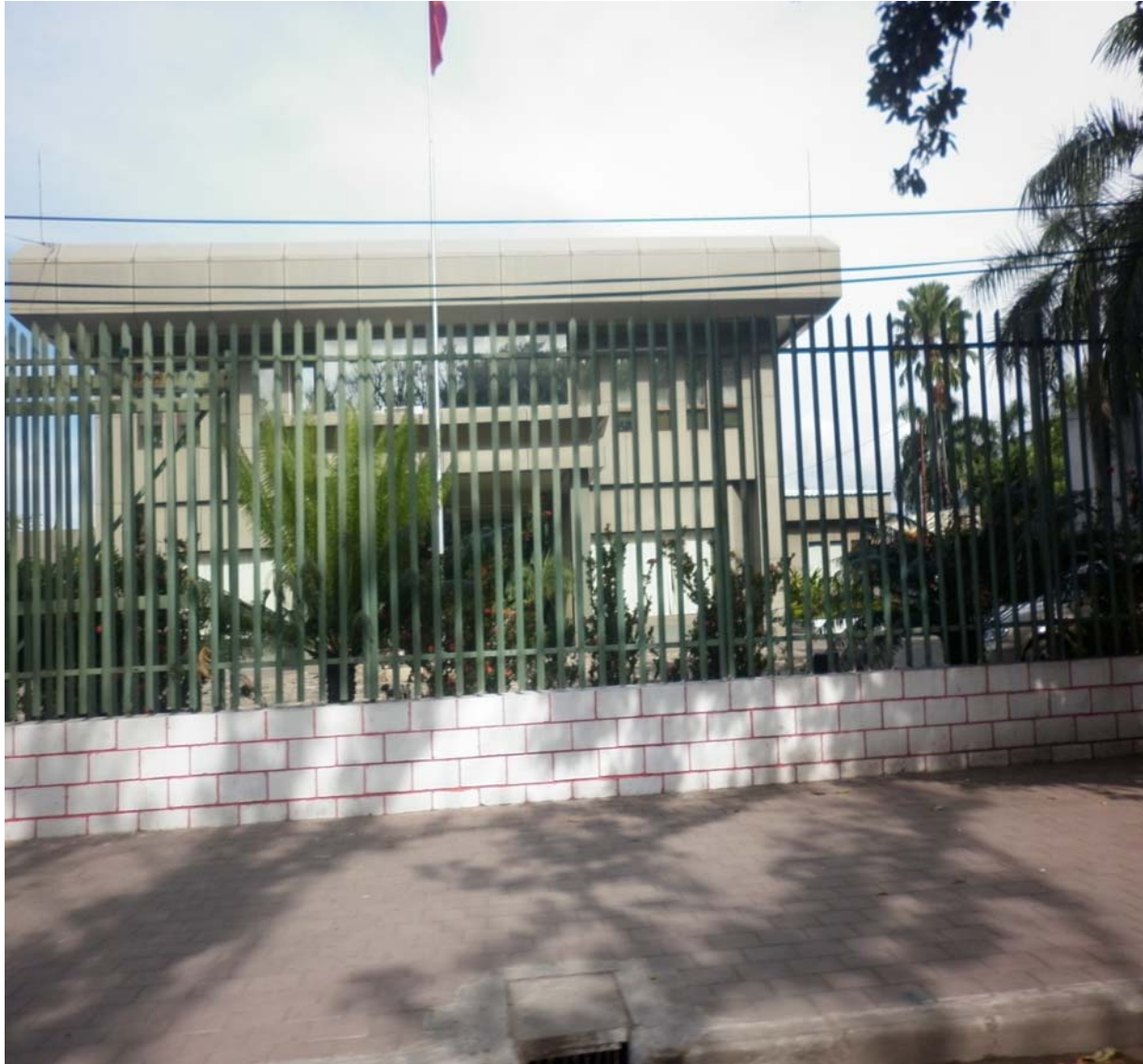
BANCO CENTRAL DE TIMOR-LESTE

Iha tinan 2010, kompras assets/ativus kapital nian ho valor $54m. Indústria 'Manufatura nian' investe tan fali ho proporsaun ne'ebé boot liuhotu husi nia lukrus ba iha despezas kapital nian, ho 45 pursentu husi lukrus utiliza osan ho valor $9m husi kompras kapital nian.