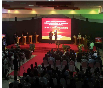
Debate kandidatura PR Dili, 17 Marsu 2017