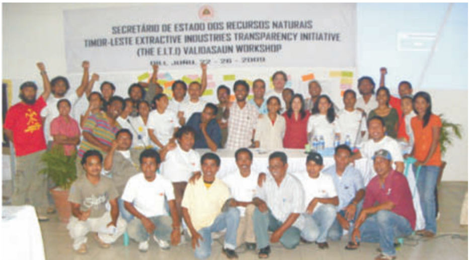
Alfredo Pires Secretário de Estado dos Recursos Naturais

A sociedade civil é um elemento importante no processo da EITI. Nesta imagem notamos a participação de NGO's locais dos 13 distritos de Timor-Leste que participaram num dos colóquio da EITI organizado em Timor-Leste.