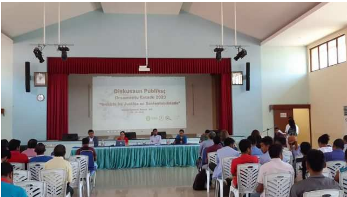
Diskusaun públiku OJE 2020.