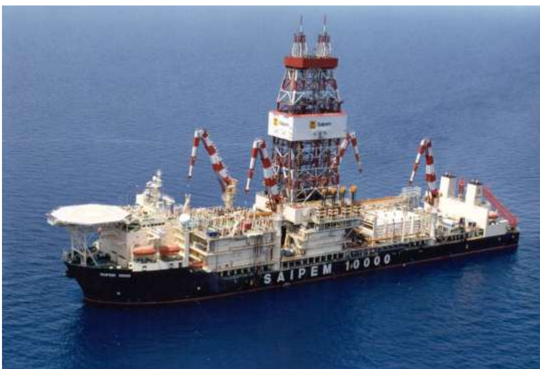
Figura ES.2 Saipem 10000.

Cova-1 ne'e planeia ona atu halo serbisu perfurasaun iha fulan-Setembru 2010 nu'udar esplorasauun vertikál ida. Perfurasaun ne'e sei utiliza ró-fura nian, Saipem 10000 (Figura ES.2). To'o mai iha lokál, ró ne'e-fura nian ne'e sei liuhosi nia pozisaun no hela iha pozisaun ne'e utiliza sistema Posisionamentu Dinámiku Klase III.