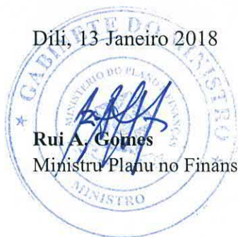
Rui A. Gomes Ministru Planu no Finansas